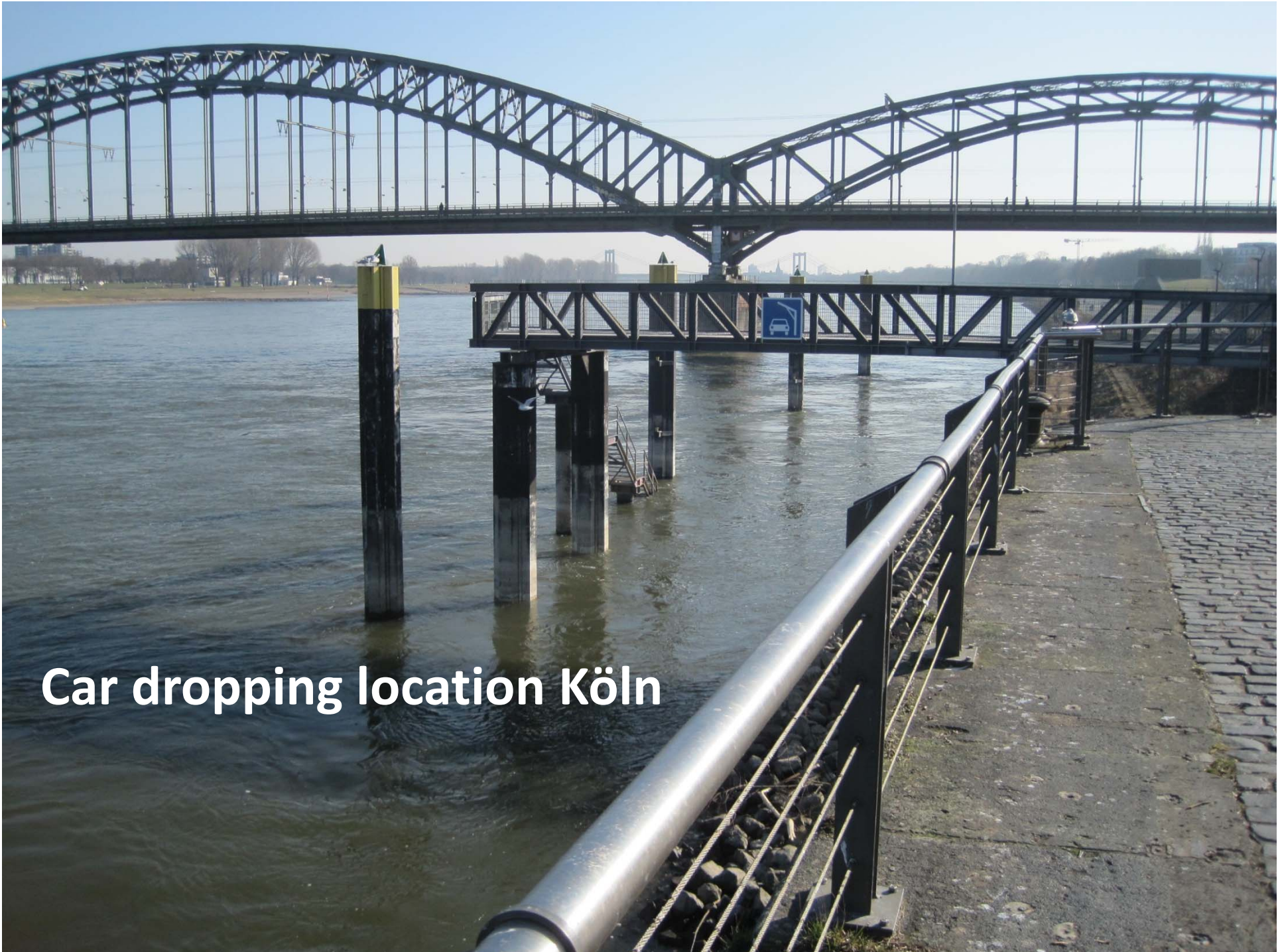
Car dropping location Köln